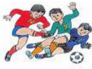
đá bóng (đá banh)