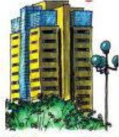
nhà tầng (nhà cao tầng)