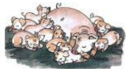
đàn lợn (đàn heo, bầy heo, bầy lợn)