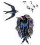
tô yến (con yến)